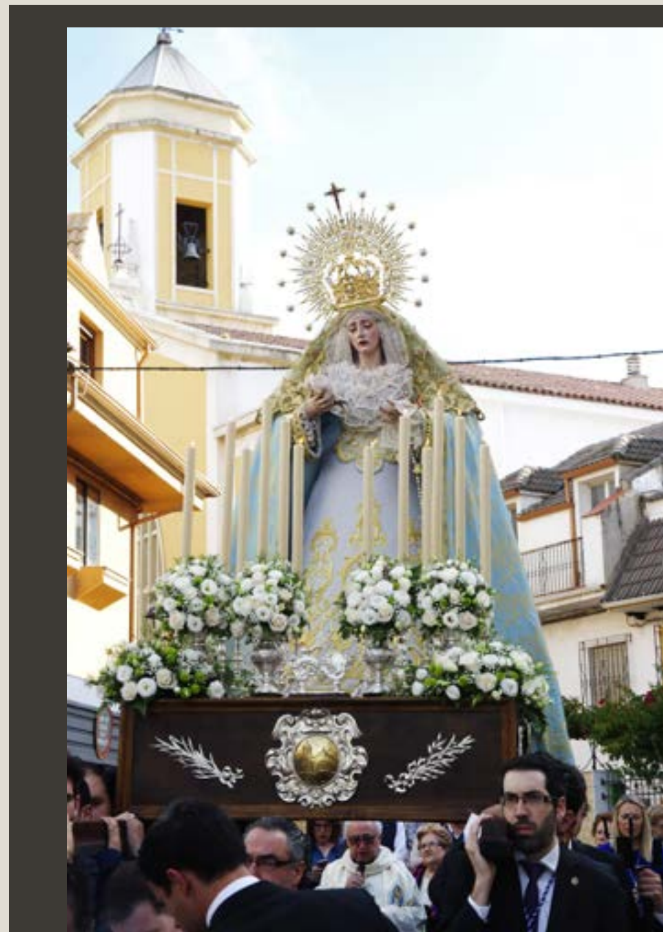
Rosario Vespertino Virgen de la Paz 13-05-2017

Se cuenta que estando predicando Santo Domingo a los cátaros del sur de Francia, y con un balance de evangelización bastante bajo, el santo fundador de la Orden Benedictina pidió intercesión y fuerza a la Santa Virgen María. De este modo, María se le apareció a Santo Domingo y le dijo que el rezo del Santo rosario era una potente arma para ayudar a convertir a los herejes y limpiar el corazón de los pecadores. Además, le encomendó a Santo Domingo que propagase la oración no solo entre los infieles, sino también entre los cristianos del mundo entero.