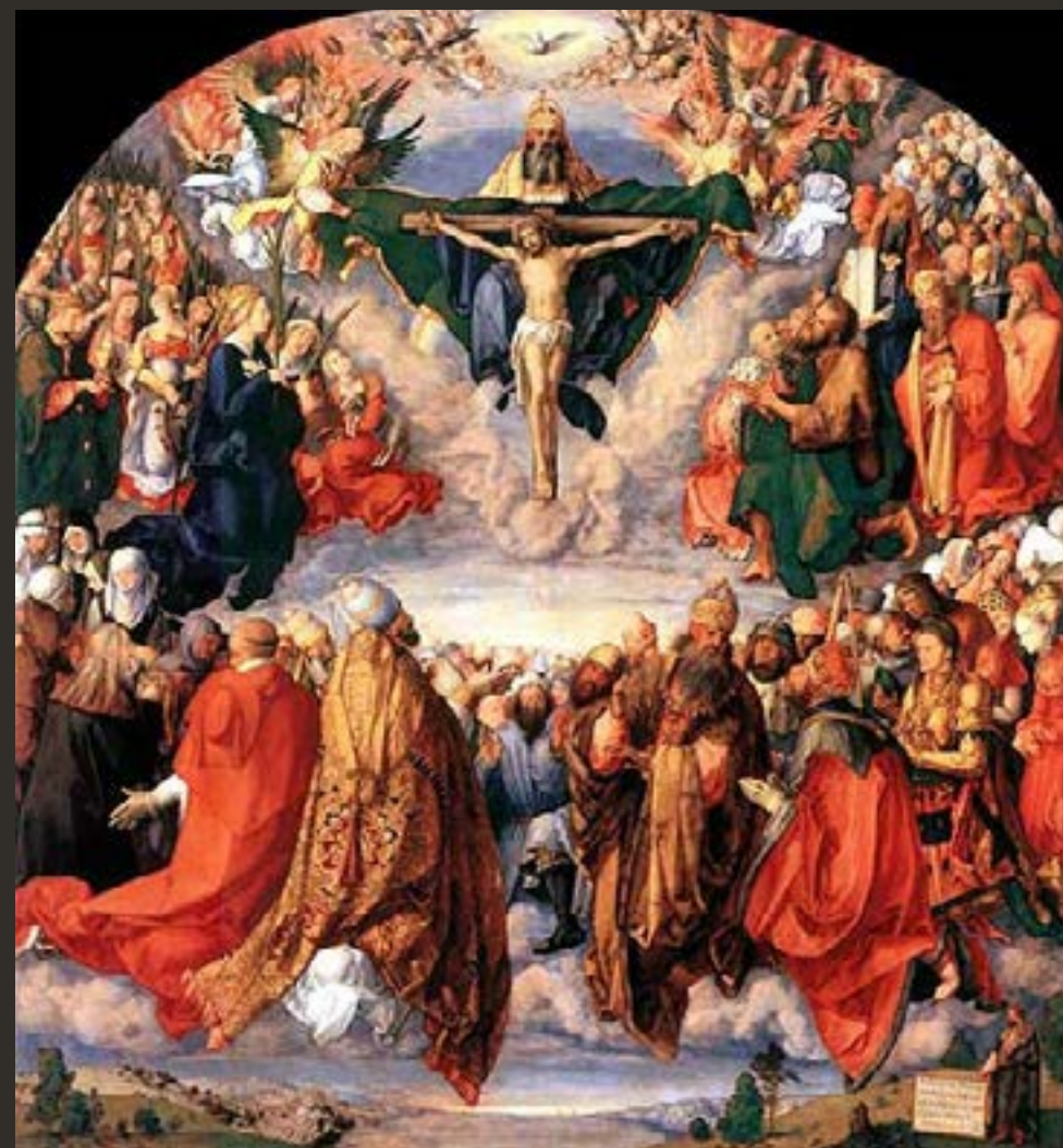
Día de todos los difuntos: El español.

La veneración a los santos se basa en la creencia de la Comunión de los Santos, es decir, ellos escuchan nuestras súplicas e interceden ante Jesucristo por la humanidad, tanto por los vivos en la Tierra y por los difuntos en el Purgatorio.