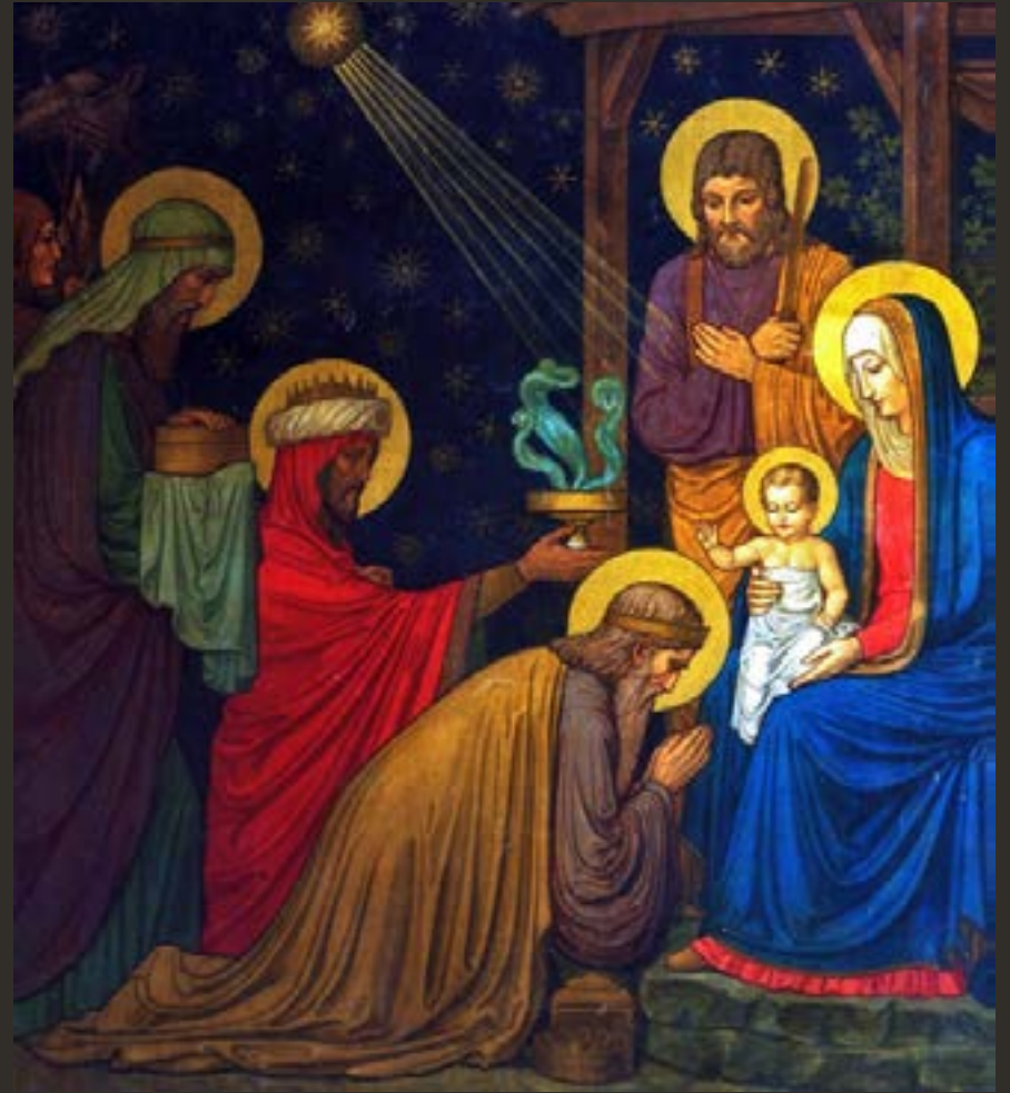
La epifanía del señor (Catholicvs).

Esto nos ayuda a reflexionar en la clase de regalos que nosotros debemos ofrecer y a reconocer que lo importante no es el regalo en sí, sino el saber darse a los demás. En la vida debemos buscar a Dios sin cansarnos y ofrecerle con alegría todo lo que tenemos. Los Reyes Magos sintieron una gran alegría al ver al niño Jesús; supieron valorar el gran amor de Dios por el hombre. Debemos ser estrella que conduzca a los demás hacia Dios.